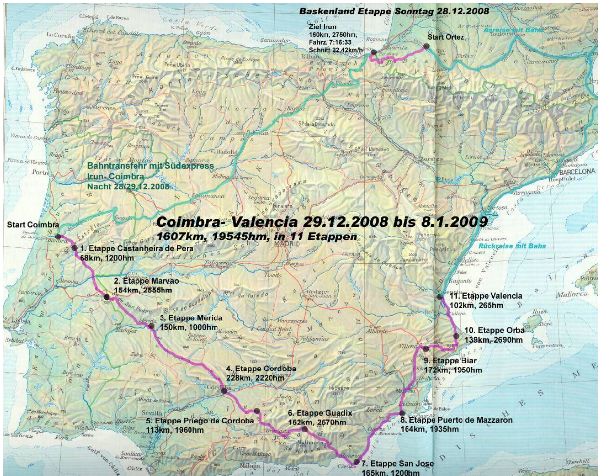
Klemens & Leo Bont & Heini Studer

Und tatsächlich schaffen wir es so wieder zurück in die Schweiz, nach rund 1'600 km mit nahezu 20'000 Höhenmetern auf 11 Etappen.